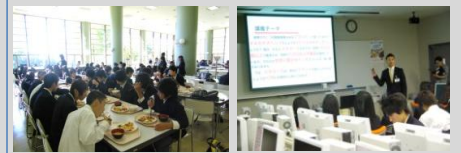
新潟経営大学にて