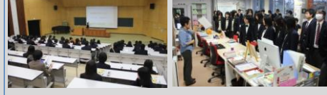
新潟大学にて 新潟県立大学にて