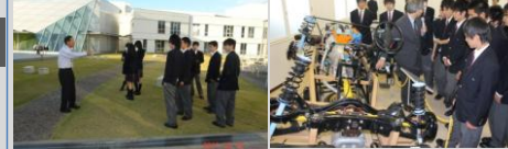
新潟工業短期大学