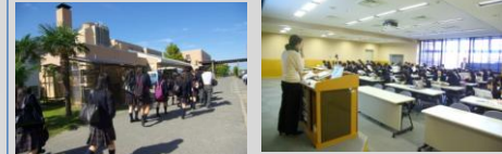
敬和学園大学にて