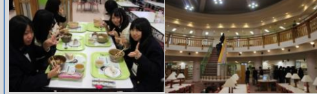
新潟県立大学にて